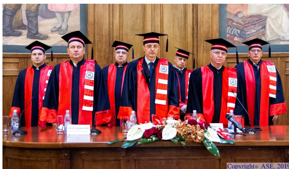
Imagine de la ceremonia de decernare Doctor Honoris Causa domnului academician Ioan Aurel Pop 03.04.2019