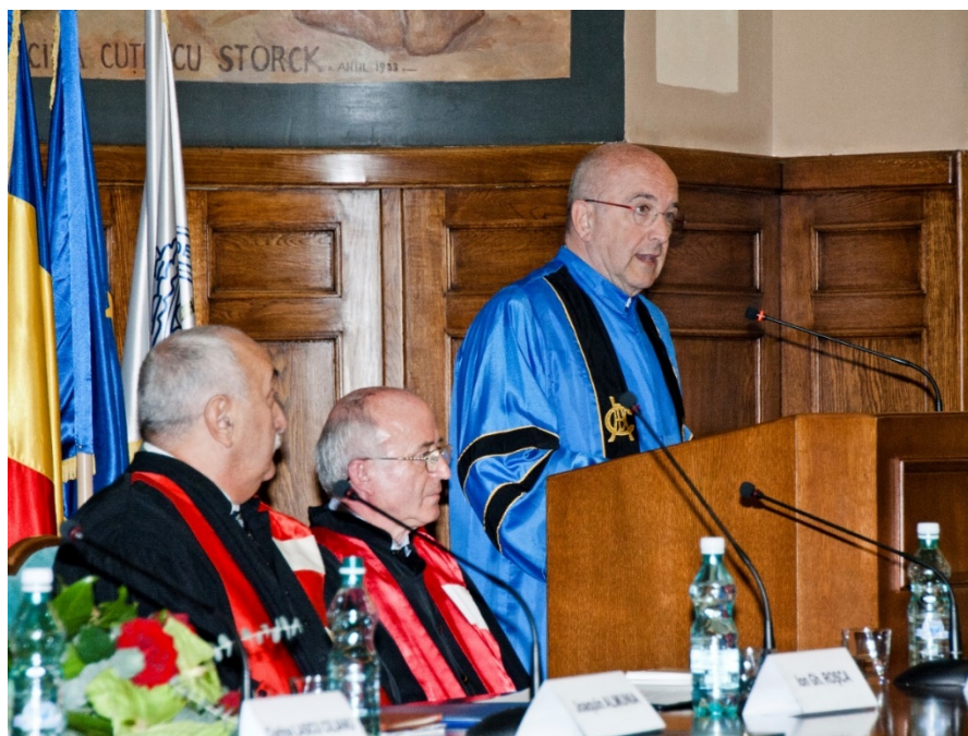
Imagine de la ceremonia de decernare Doctor Honoris Causa domnului Joaquin Almunia 21.10.2011