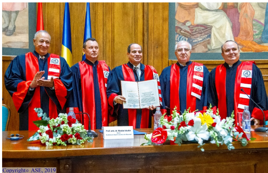
Imagine de la ceremonia de decernare Doctor Honoris Causa domnului președinte Abdel Fattah El-Sisi 19.06.2019