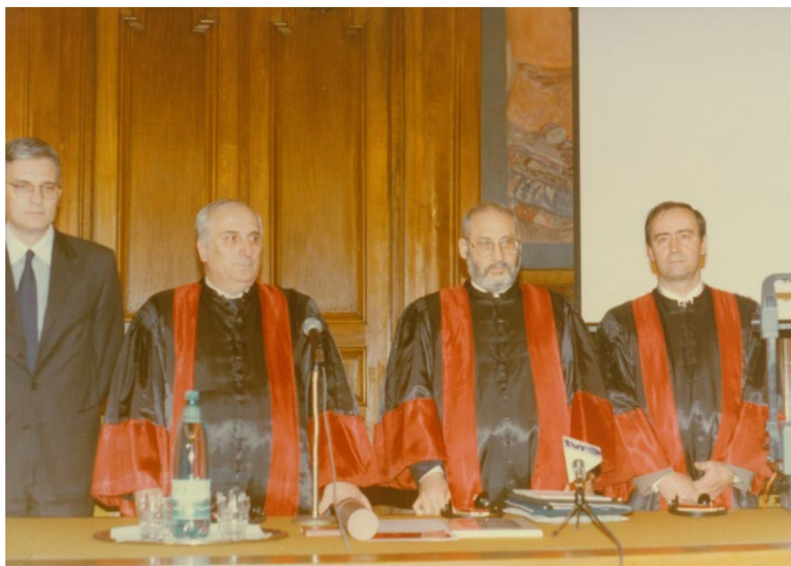
Imagine de la ceremonia de decernare Doctor Honoris Causa domnului Joseph Stiglitz 10.11.1999