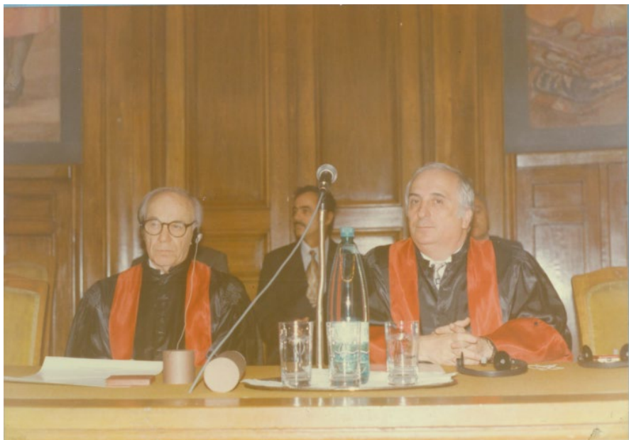
Imagine de la ceremonia de decernare Doctor Honoris Causa domnului Lawrence R. Klein 09.11.1999