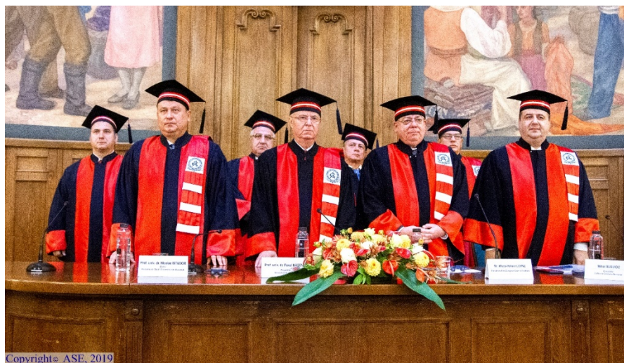
Imagine de la ceremonia de decernare Doctor Honoris Causa domnului Klaus-Heiner Lehne 30.10.2019