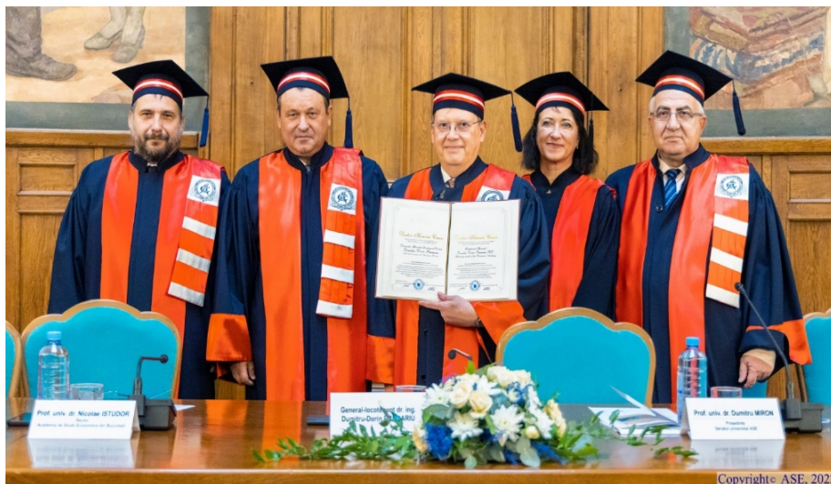
Imagine de la ceremonia de decernare Doctor Honoris Causa domnului Dumitru Prunariu 25.10.2022